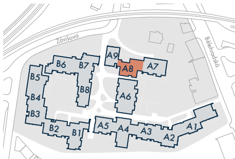
SEKCE A8 • SECTION A8